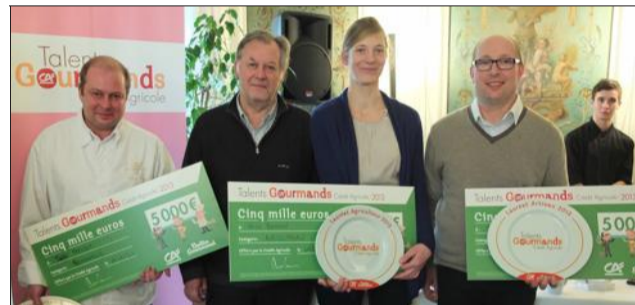
Les trois lauréats ont reçu un chèque de 5 000 €.